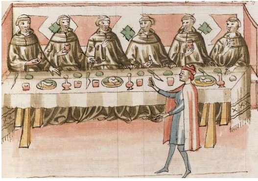
Repas de moines, XV e , BnF