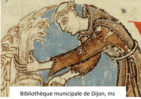
Bibliothèque municipale de Dijon, ms 170, fol. 75 v., XIII e s.