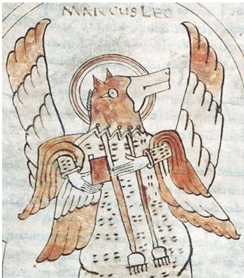
Saint Marc, X e , Landévennec ? Médiathèque du Grand Troyes, ms 960, fol. 43 v / Pascal Jacquinet