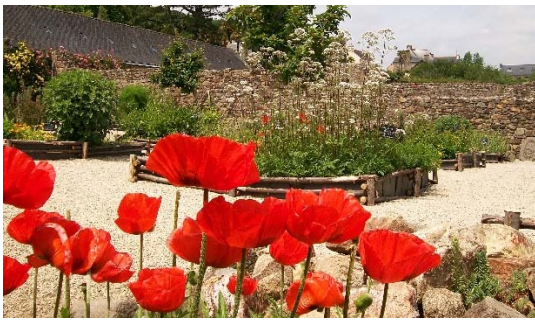
Pavots. Jardin de simples de l'Ancienne abbaye