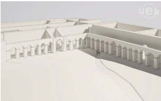
Première esquisse de la reconstitution 3D du cloître. Infographie : Alexandra Brun, CNPAO