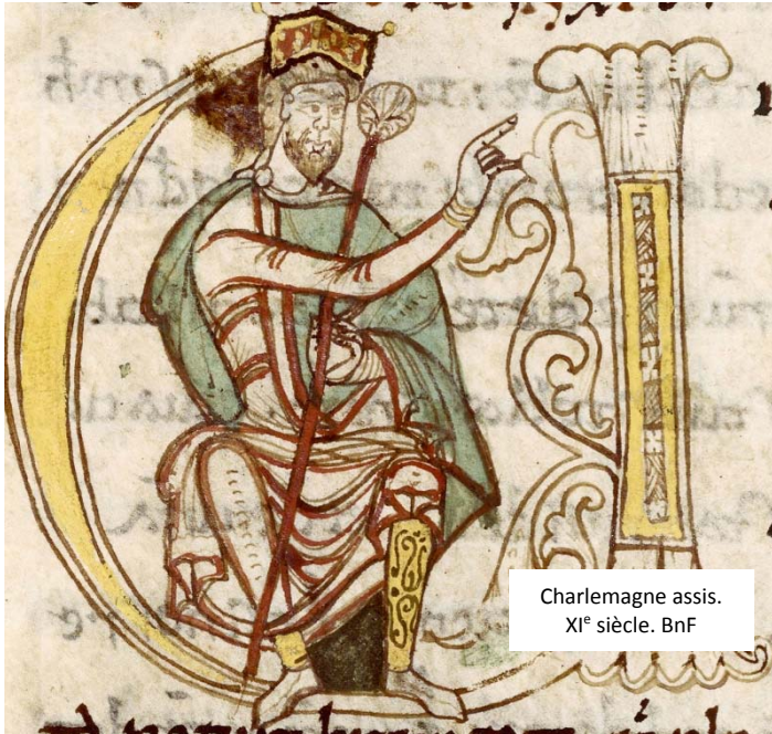
Charlemagne assis. XI e siècle.

814-2014, voilà exactement 1200 ans, Charlemagne mourait à Aix-la-Chapelle. Il était alors à la tête d'un Empire immense s'étendant de l'Europe centrale aux côtes atlantiques. Il a aussi donné son nom à une période, et un mouvement culturel, « la Renaissance carolingienne », qui marque durablement l'histoire européenne.