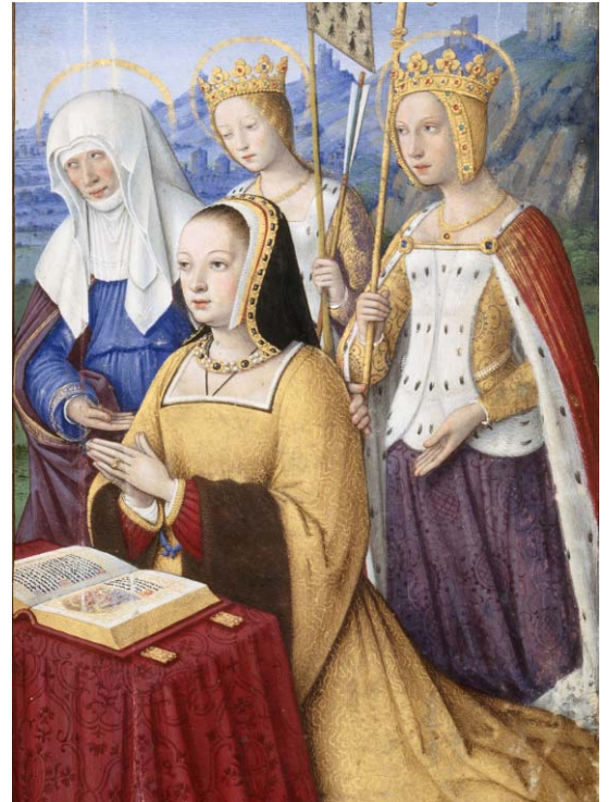
Au-dessus et à gauche : Les Grandes Heures d'Anne de Bretagne (1503-1508, BnF).

Ce manuscrit enluminé est orné des dessins de 337 plantes. Réaliste et encyclopédique, le style marque le passage à l'art de la Renaissance. L'exposition « Des moines et des plantes » présente une reproduction très rare de ce manuscrit (1859-1861, tirage limité à 850 exemplaires) prêté par la Bibliothèque bretonne de l'Abbaye Saint-Guérolé.