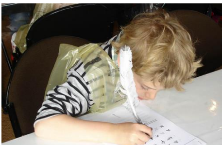
Calligraphie : apprendre à écrire comme les moines au 9 e siècle !

Landévennec, village portuaire offre, avec son église et son cimetière marin, un des panoramas de Bretagne les plus secrets. Sa situation, tout au bout d'un appendice maritime de la presqu'île de Crozon, n'y est pas pour rien. La balade passe tour à tour devant le café tenu par une Irlandaise, un excellent bouquiniste qui sert thé et boissons fraîches, et la crêperie dont la terrasse offre un superbe point de vue sur la mer. Elle aboutit au monastère bâti dans les années 1950, à une centaine de mètres du village. Ouverte dans la journée, la chapelle est à quelques pas du magasin où sont vendues les célèbres pâtes de fruits connues jusqu'au Japon !