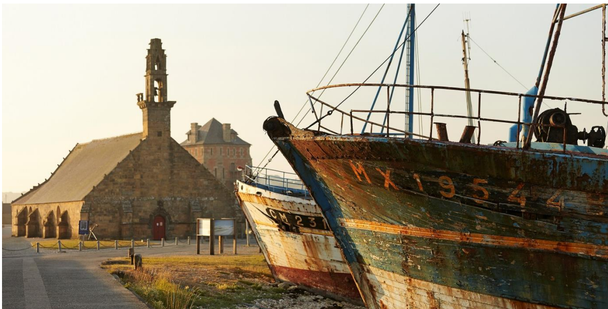
Camaret-sur-mer : la chapelle Notre Dame de Rocamadour et, à l'arrière-plan, la Tour Vauban inscrite au Patrimoine mondial.

Ancienne abbaye de Landévennec Musée de l'Ancienne abbaye 29560 LANDEVENNEC Tél. 02 98 27 35 90 / Fax. 02 98 27 35 91 www.musee-abbaye-landevennec.fr