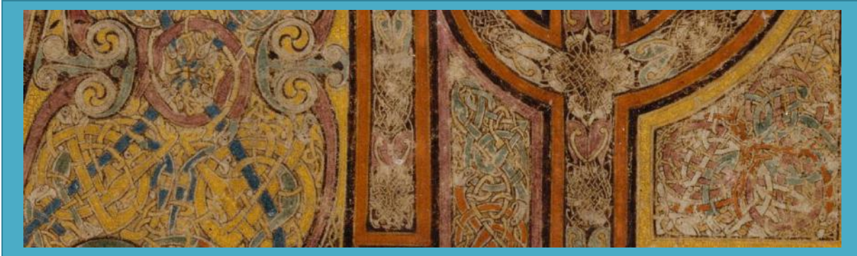
Levr Kells, Trinity College Library, Dublin, Ms 58 fol. 34 r.

A-hed ar bloaz Niver a skolidi uhelañ: 30