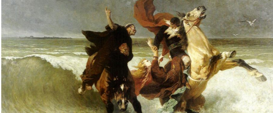
Fuite de Gradlon, Evariste-Vital Luminais, 1884 • Mirdi arzoù kaer Kemper

A-hed ar bloaz Abadenn er maez Niver a skolidi uhelañ : 30