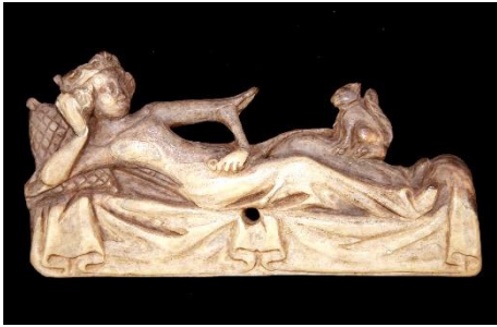
Applique « femme à l'écureuil », os, 14 e siècle

Ce statut offre une meilleure protection juridique aux objets contre le vol et les destructions. Elle rend également les collections éligibles à des aides de l'Etat (restaurations, mise en valeur...).