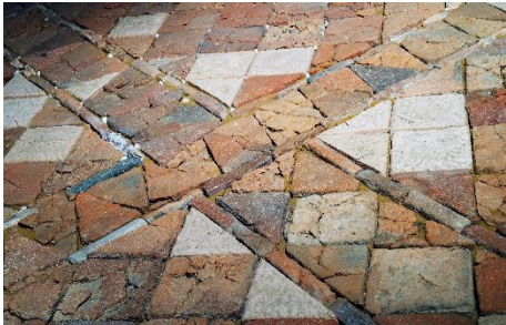
Pavement de l'église, 10 e siècle